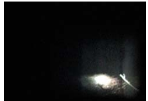
Still da video